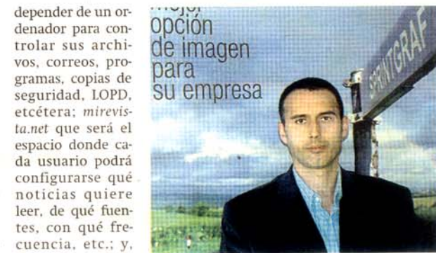
Director y director comercial de Grupo Sprint.

dependen de un ordenador para controlar sus archivos, correos, programas, copias de seguridad, IOPD, etcétera; mirevista.net que será el espacio donde cada usuario podrá configurarse qué noticias quiere leer, de qué fuentes, con qué frecuencia, etc.; y, por supuesto, misrecursos.net, empresa de hosting de servicios web que albergará a los dos anteriores y todas aquellas que la demanda de nuestros clientes vaya solicitando. Sin